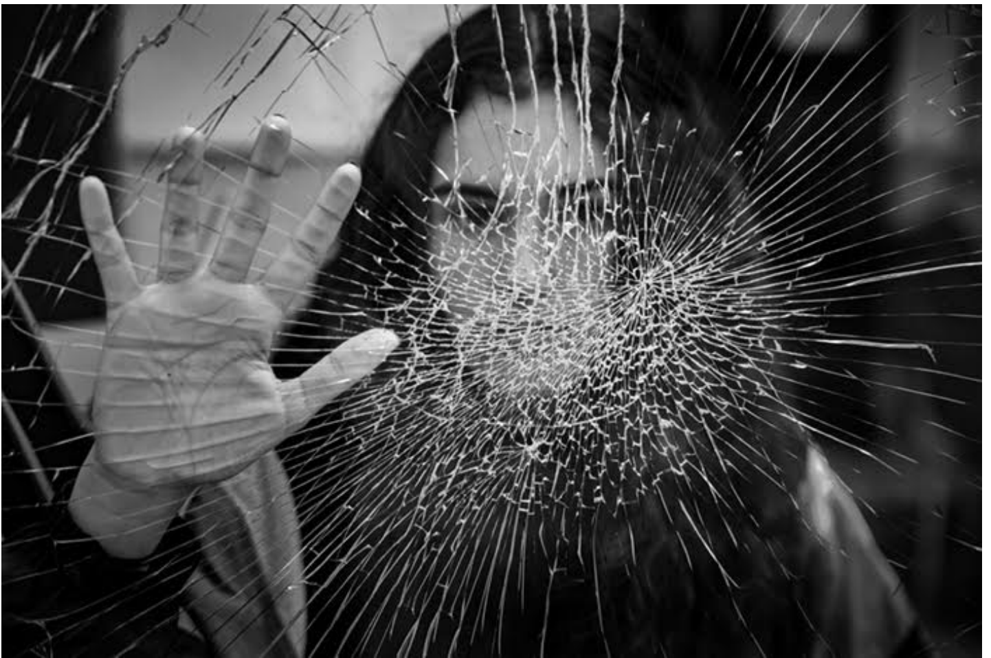
1ª Posición: Antonio Benete