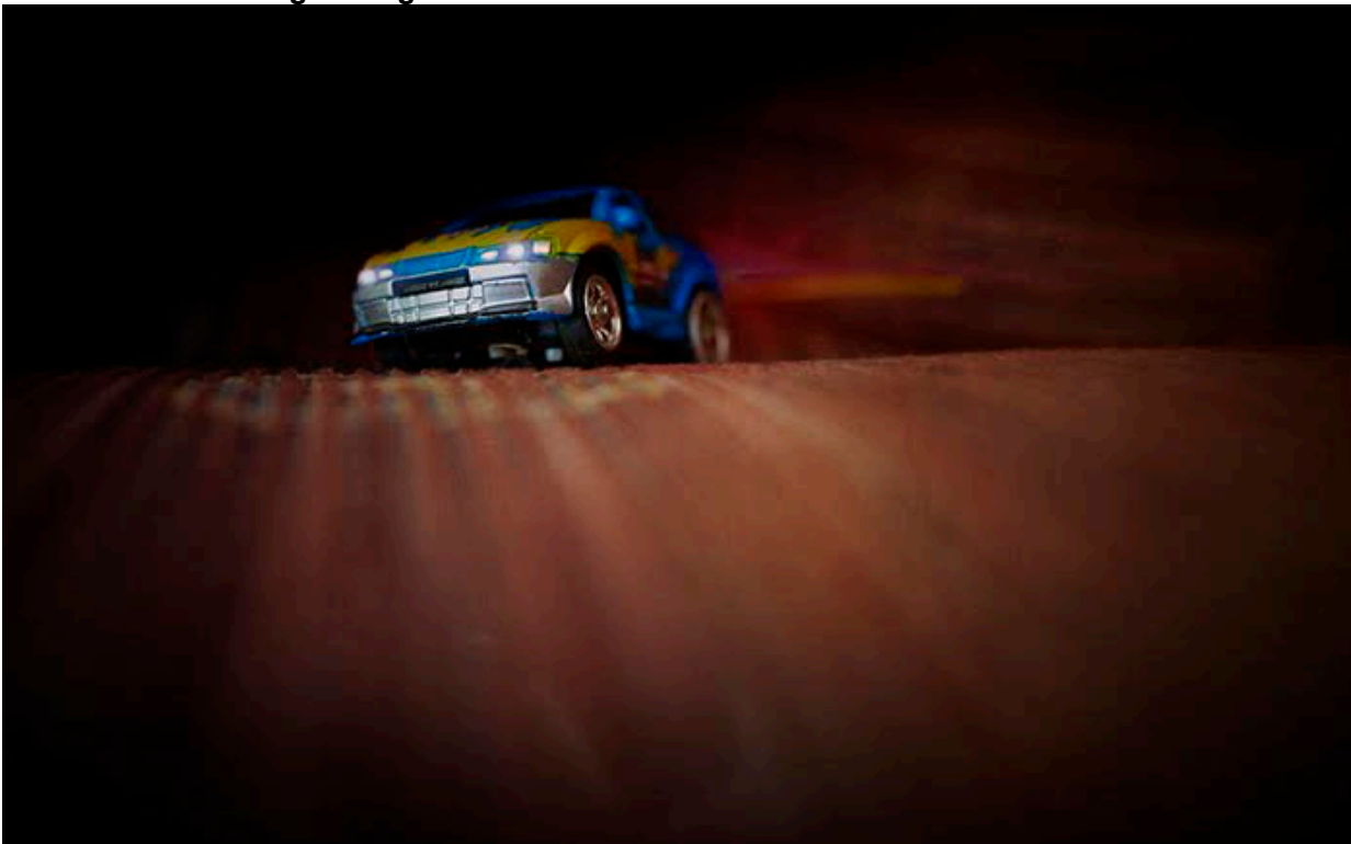
1ª Posición - Cristóbal Rubio