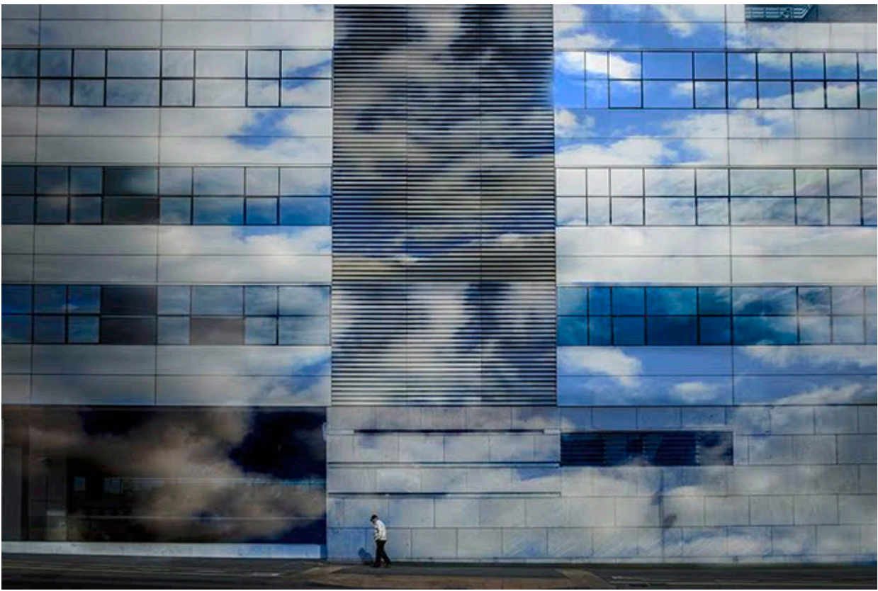
2ª Posición: Alfredo Romero