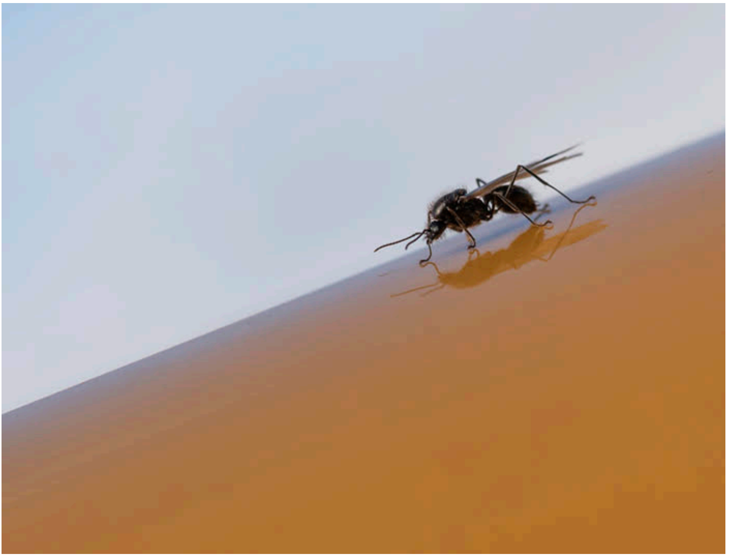
5ª Posición: Asunción Galera