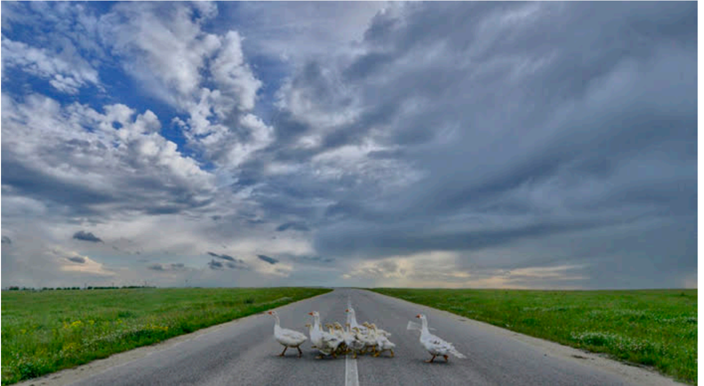
2ª Posición: Jorge Rapallo